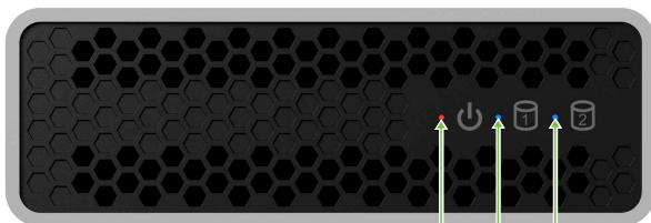
LED für Betrieb

Konfiguration eines RAID-Controllers mit mehreren Festplatten, die keinen Verbund bilden. Damit werden die angeschlossenen Festplatten dem Betriebssystem einzeln zur Verfügung gestellt.