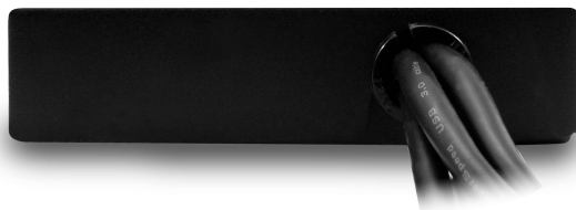
20 Pin 3.0 Konnektor für Cardreader und USB 3.0 Frontanschluss