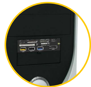
IB-868 im 3,5" Einbauschacht