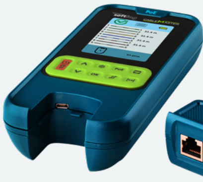
Abnehmbare Remote-Einheit mit RJ45 Port