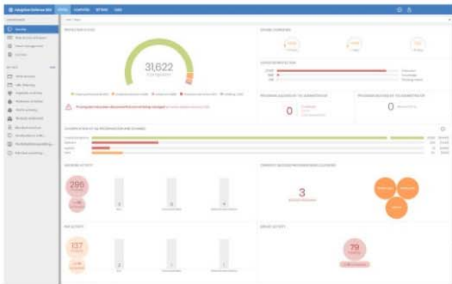
Abbildung 1: Zentrales Dashboard von Panda Adaptive Defense 360