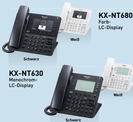
KX-NT680 Farb- LC-Display