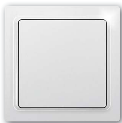
Funktaster mit Wippe