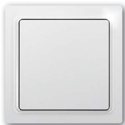
Funktaster mit Wippe