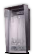
9135361D Wetterschutzrahmen und UP-Gehäuse für 1 Modul

225x235x46 mm Wandaussparung: 210x220x50 mm