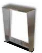
9135332D Wetterschutzrahmen für 2 Module