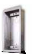
9135351D UP-Gehäuse für 1 Modul

125x235x46 mm Wandaussparung: 110x220x50 mm