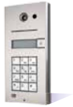
9137111CKD Basic, 1 Rufaste, Kamera und Tastatur 9137110CKD Pro, 1 Rufaste, Kamera und Tastatur