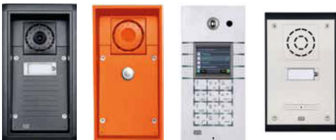
2N®EntryCom IP Force