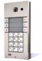
9137161CKD Basic, 6 Rufasten, Kamera und Tastatur 9137160CKD Pro, 6 Rufasten, Kamera und Tastatur