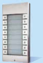
9135182D 16 Tasten Erweiterung