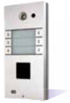
9137161CD Basic, 6 Rufasten und Kamera 9137160CD Pro, 6 Rufasten und Kamera