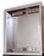
9135352D UP-Gehäuse für 2 Module

125x235x46 mm Wandaussparung: 110x220x50 mm